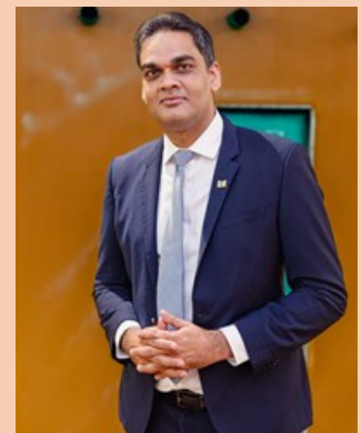
Minister Amar Ramadhin