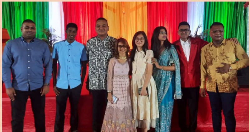
Leden van de VHP-Jongerenraad

De Jongerenraad van de VHP speelt een essentiële rol in het betrekken van jongeren bij de politieke besluitvorming en maatschappelijke ontwikkeling van Suriname. Als werkmarm van het Hoofdbestuur richt de Jongerenraad zich op thema's die direct invloed hebben op de toekomst van jongeren, zoals onderwijs, huisvesting en werkgelegenheid. Daarnaast houdt de raad zich bezig met de leefomgeving van jongeren, met speciale aandacht voor sport, recreatie en algemene vorming.