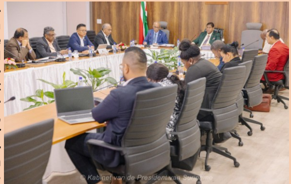
Leden van het kabinet

De VHP erkent dat goed bestuur de sleutel is tot een sterke democratische rechtsstaat en heeft deze kernwaarde in artikel 2 van de Statuten van de partij opgenomen. De partij is doordrongen van het feit dat de rechtsstaat Suriname zwaar op de proef wordt gesteld ter zake goed bestuur en kiest ervoor om in dat kader met hoge prioriteit wetgevingsproducten tot stand te doen brengen. Wat dat betreft sluit het regeerbeleid van President Chan Santokhi naadloos aan bij de verplichtingen ingevolge de Surinaamse Grondwet (artikelen 1, 8 en 52), internationale verdragen en artikel 2 van de VHP Statuten. Er is voor gekozen om alle internationale verplichtingen in snel tempo in de nationale rechtssfeer te implementeren om transparantie, integriteit en efficiëntie te bevorderen. Zie de implementatie van de Anti-Corruptiewet en het Besluit Verklaring van Inkomen en Vermogen en Register Ontvangstbewijzen, etc.